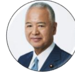
Akira Amari Former Member of the House of Representatives Honorary Chairman, Diet Members Caucus for the Promotion of Semiconductor Strategy (, LDP)