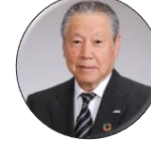
東哲郎 Rapidus 取締役会長