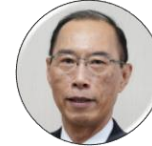
Ryuichi Yokota Mayor Chitose City