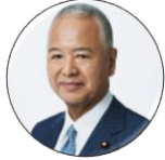
甘利明 前衆議院議員 自民党半導体戦略推進議員連盟 名誉会長