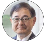
寶金清博 北海道大学 総長