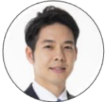
13:45-13:55 Guest Remarks Naomichi Suzuki, Governor of Hokkaido