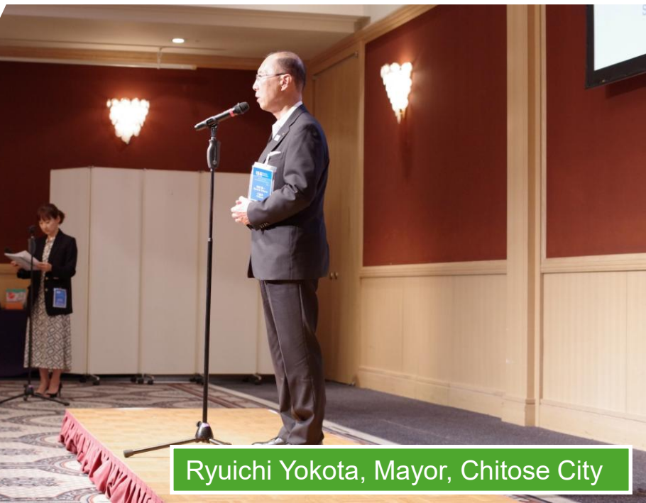
Ryuichi Yokota, Mayor, Chitose City