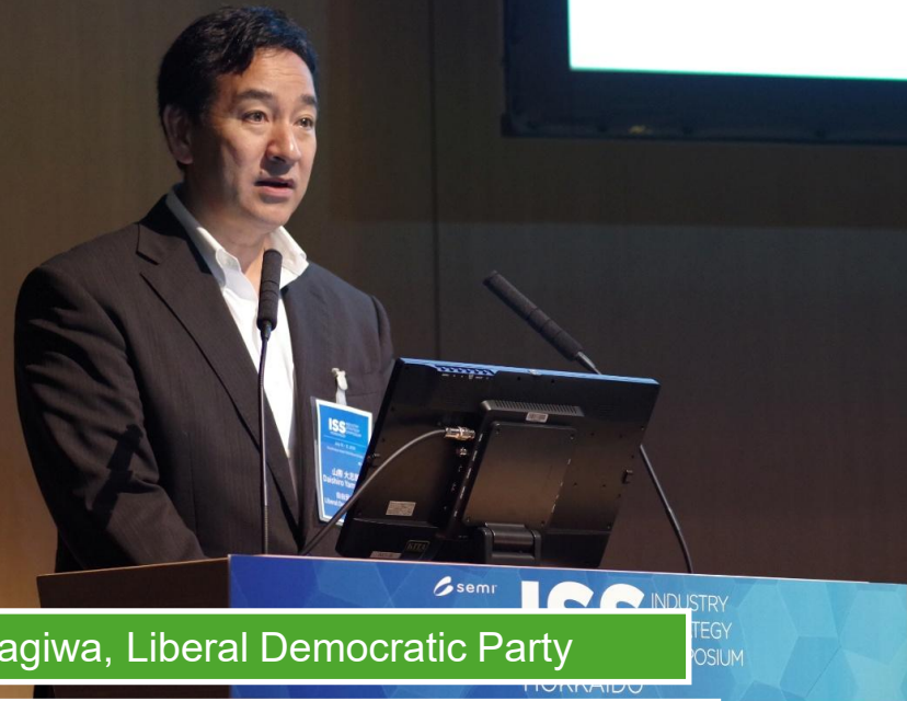
Daishiro Yamagiwa, Liberal Democratic Party