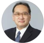
13:55-14:25 Special Address 1 (Remote Live) Satoshi Nohara, Director- General, Commerce and Information Policy Bureau, METI