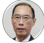
横田隆一 千歳市長