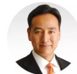
8:33-9:03 Daishiro Yamagiwa, Member of the House of Representatives, Liberal Democratic Party

8:30-10:05 Session 4 Japan's International Competitiveness