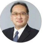
13:55-14:25 特別講演 1 野原諭 経済産業省 商務情報政策 局長