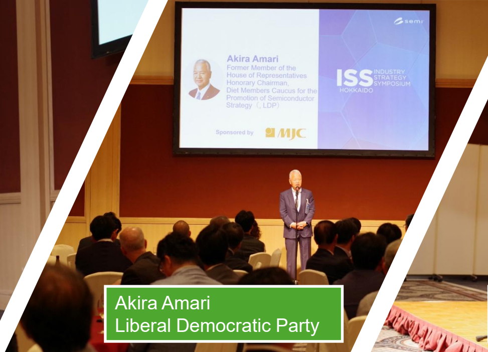
Akira Amari Liberal Democratic Party