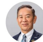
16:21-16:51 Future of Semiconductors Atsuyoshi Koike CEO Rapidus