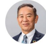
16:21-16:51 半導体の未来 小池淳義 Rapidus 代表取締役社長兼CEO