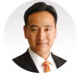
8:33-9:03 山際大志郎 自由民主党 衆議院議員