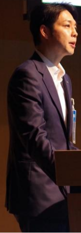
Naomichi Suzuki, Governor of Hokkaido