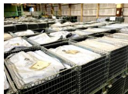
長期儲放防銹儲存盒