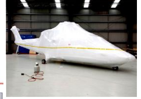
大型 / 特殊形狀 防銹包裝膜