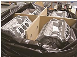
車用模具防銹包裝袋