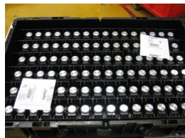
可重複使用 電子產品防銹儲存盒